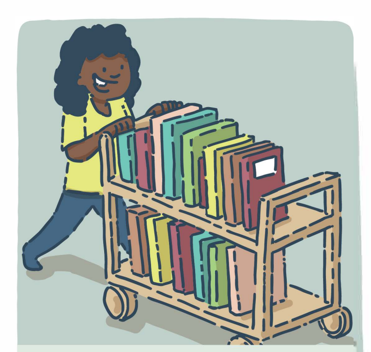
Aller à la bibliothèque