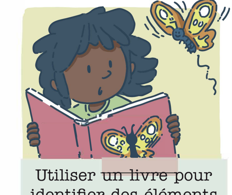
Utiliser un livre pour identifier des éléments de la nature (par ex. : les arbres, les insectes, les roches, etc.)