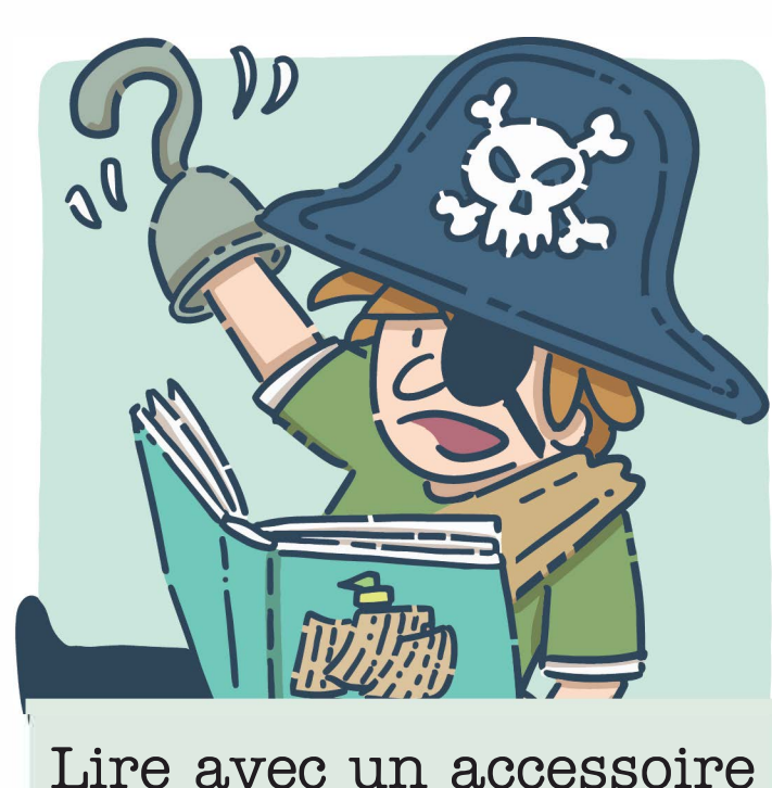
Lire avec un accessoire ou un costume en lien avec l'histoire