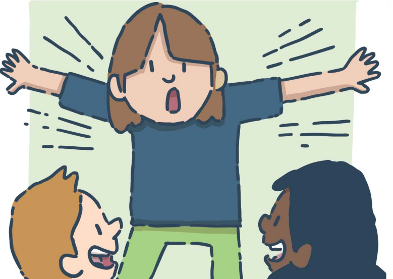
Faire des charades