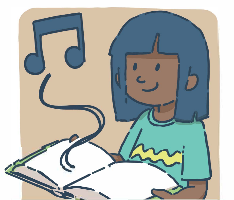
Trouver des mots qui riment pour créer une chanson