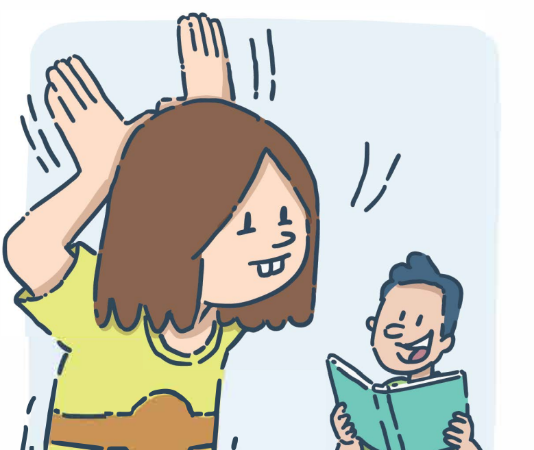
Mimer ou interpréter les personnages durant la lecture d'une histoire