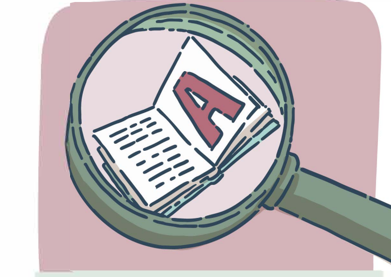
Trouver et lire un livre selon des caractéristiques (par ex. : titre le plus court, le plus long, page couverture la plus colorée, etc.)