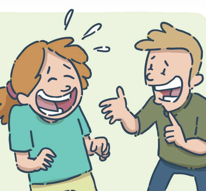
Raconter des blagues