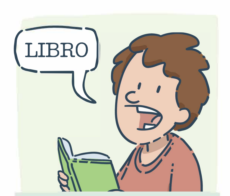
Apprendre des mots dans une autre langue