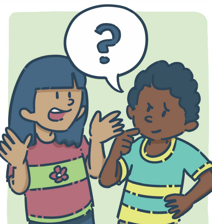
Faire des devinettes