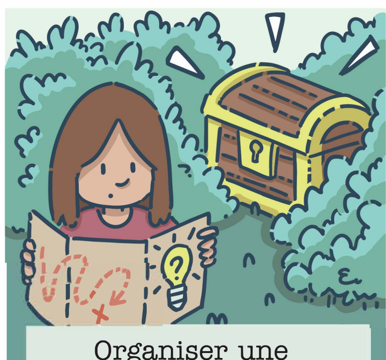
Organiser une chasse aux trésors à l'aide d'indices