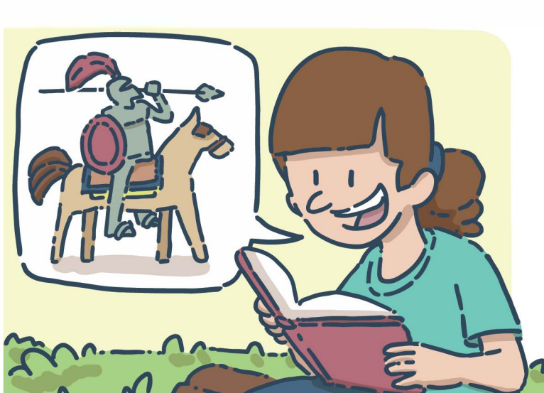
Lire ou raconter une légende