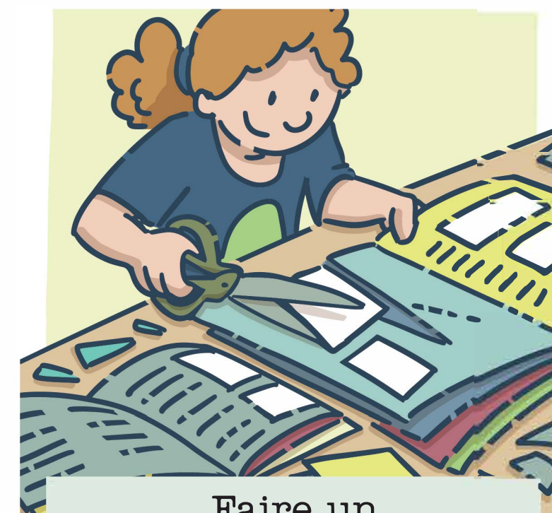
Faire un bricolage avec de vieux magazines