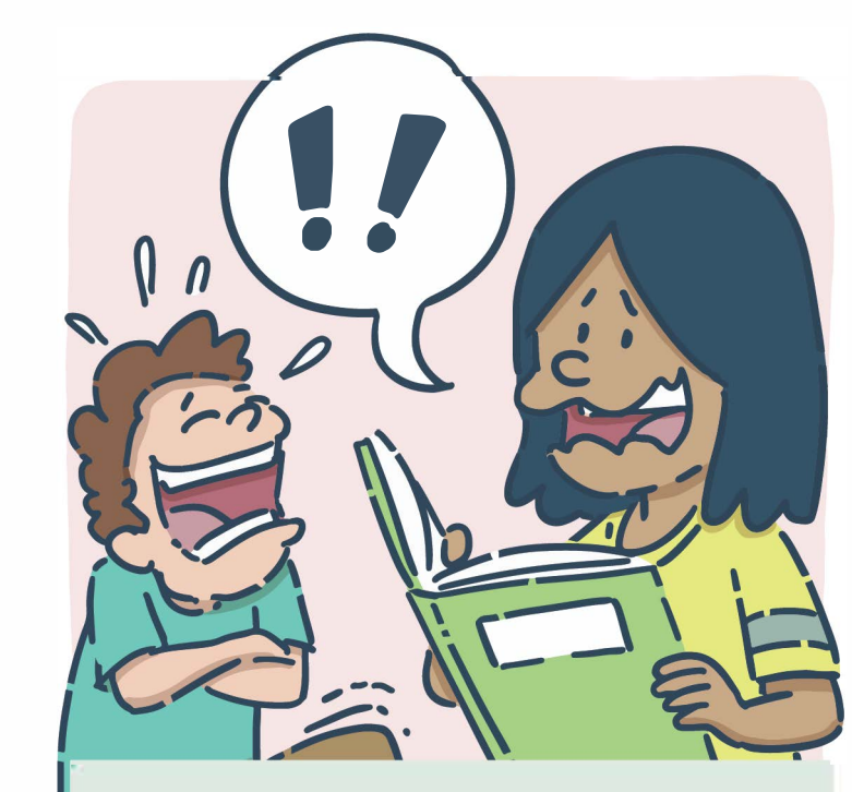
Lire avec une drôle de voix