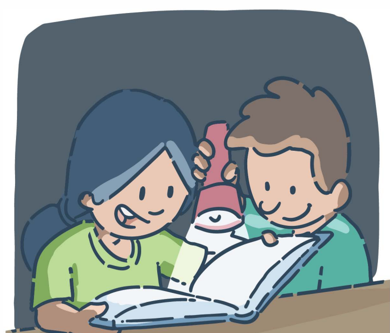
Lire dans le noir avec des lampes de poche