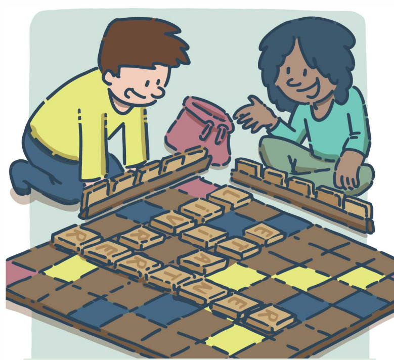
Jouer à un jeu de société