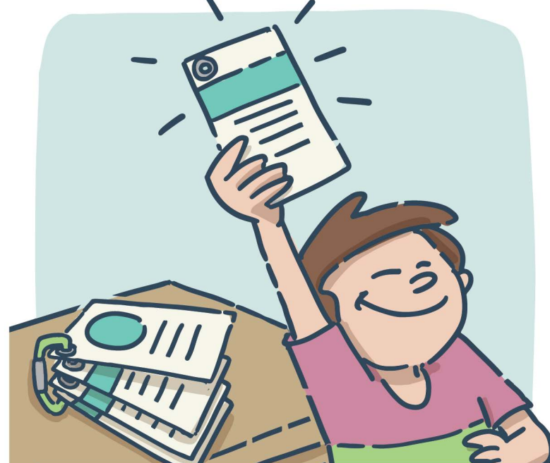
Faire une activité proposée dans les fiches Lit de camp