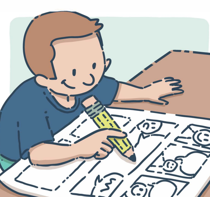
Créer une bande dessinée