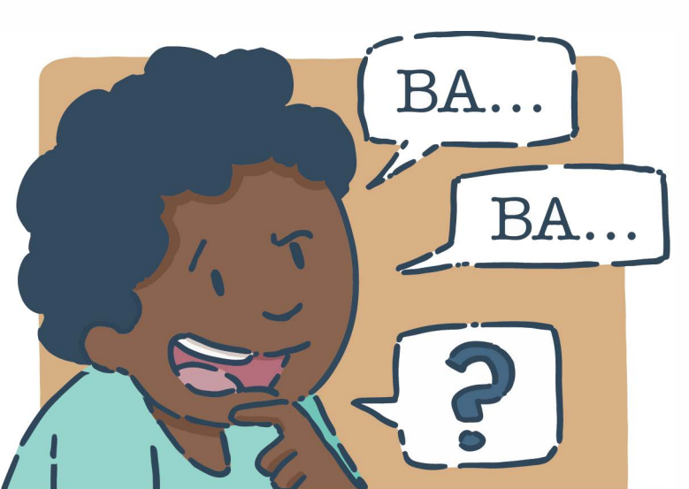
Trouver le plus de mots possibles qui commencent par le même son