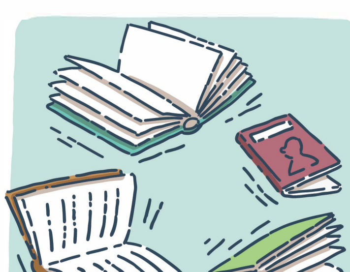
Offrir un moment de lecture libre