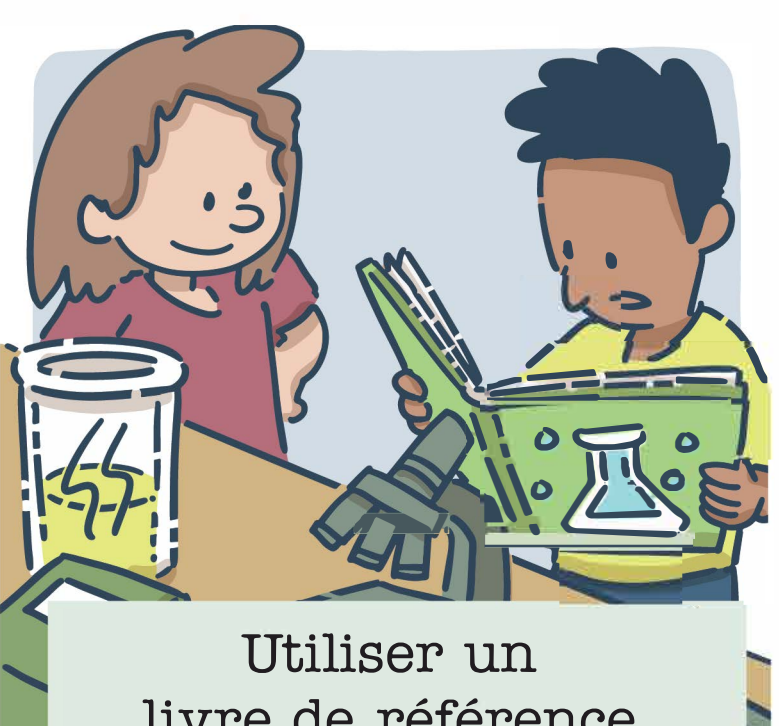
Utiliser un livre de référence pendant une activité scientifique