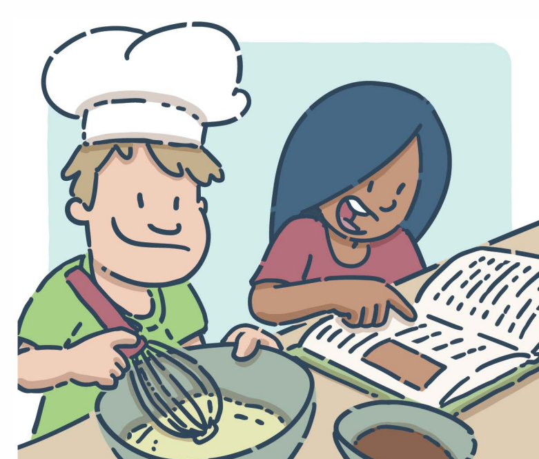
Lire et réaliser une recette